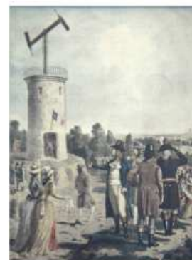
Premier télégraphe optique entre Paris et Lille en 1794

On a ainsi utilisé différents types de signaux comme, en 1794, le télégraphe optique de Claude Chappe. Des tours à signaux étaient placées à visible distance l'une de l'autre. De grands leviers s'élevaient et s'abaissaient de ces tours épelant par différentes positions les messages de poste en poste jusqu'à destination. Ces différents mécanismes de transmission avaient leurs inconvénients : les signaux visuels ne pouvaient pas être utilisés sur de longues distances ni dans n'importe quelles conditions. Le document écrit par exemple, transmis par des messagers, mettait souvent beaucoup trop de temps pour arriver à destination.