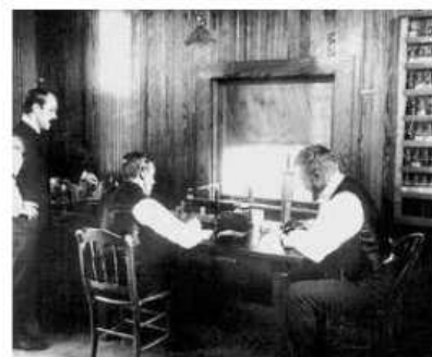
EN 1906, Fessenden transmet la voix entre Machrihanish, Écosse, et Brant Rock, Massachusetts.

Seulement cinq ans après la transmission transatlantique historique de Marconi, les opérateurs radio sur les bateaux du même océan furent surpris d'entendre une voix humaine sortir des équipements construits par Marconi et qui ne produisaient habituellement que des signaux en Morse. On était alors en 1906 et Reginald Fessenden, venait de réaliser ainsi sa première transmission audio à longue distance. En effet, la voix et la musique furent transmises sans fil entre Brant Rock, Massachusetts, États-Unis, et un navire sur l'Atlantique par Fessenden.